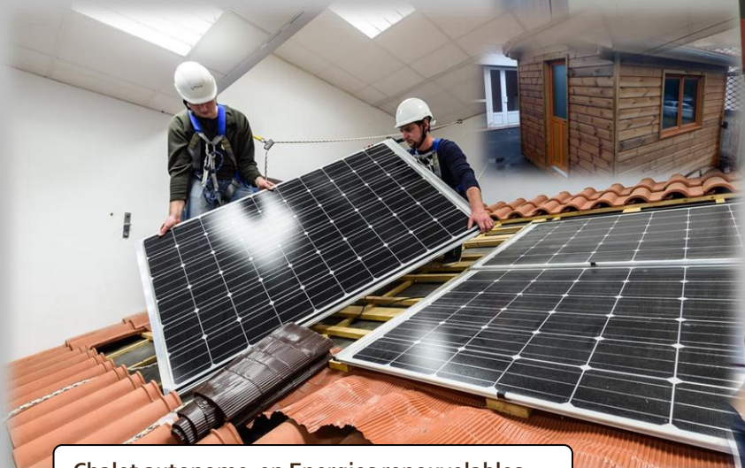
Chalet autonome en Energies renouvelables