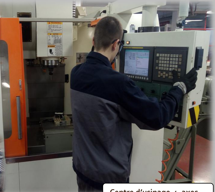
Centre d'usinage 4 axes